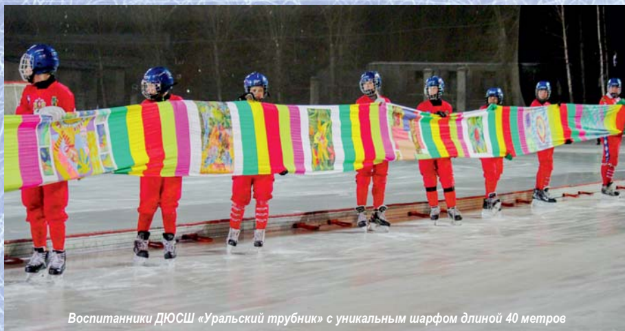
Воспитанники ДЮСШ «Уральский трубник» с уникальным шарфом длиной 40 метров

Вполне возможно, что болельщики ждали от "Уральского трубника" более убедительной победы над переживающей нелёгкие времена "Волгой". Но в нелегко складывавшейся встрече наши проявили настойчивость, целеустремлённость и взяли желанные три очка. Сегодня первоуральских хоккеистов ждёт ещё более сложное испытание в матче со значительно укрепившим свои ряды "Стартом". Но задача остаётся прежней – только победа!