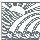
Г Р У П П А Ч Т П З